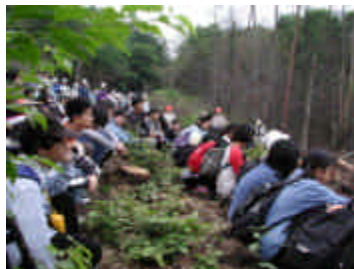
鷓沼中学校の森林環境体験学習

同じく「緑の再生プロジェクト」の一環として、百六十名以上の中学生に、伐採と地帯の技術指導を行いました。小雨混じりのあいにくの天候でしたが、皆、雨合羽を着たり傘を差したりしながら、作業を楽しんでいるようでした。