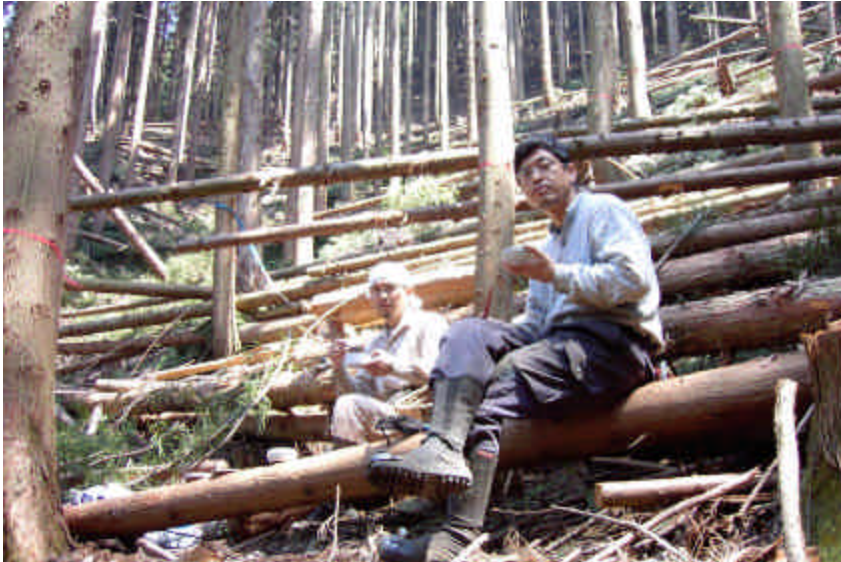
山県市の間伐作業現場にて