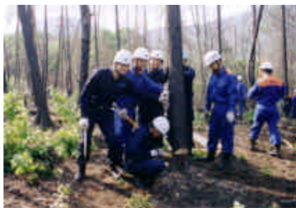
消防学校学生の体験実習で 焼損木を伐採（各務原市にて）

今、各務原市で秋に植栽が予定されている山火事跡地の伐採作業と整地作業をしています。森林ボランティアの方々を受け入れながら山火事跡地の再生作業を行うという試みもしています。すでに、消防学校の新任研修や各務原市立鵜沼中学校の1年生の野外教育活動の一環として、作業ボランティアを受け入れました。できるだけ多くの人が緑の再生活動に関わりを持つことで森林に関心を持ってもらい、山への感謝の気持ちが芽生えれば良いなと思っています。